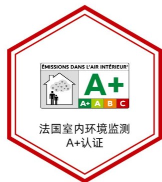
法国室内环境监测 A+认证