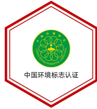
中国环境标志认证