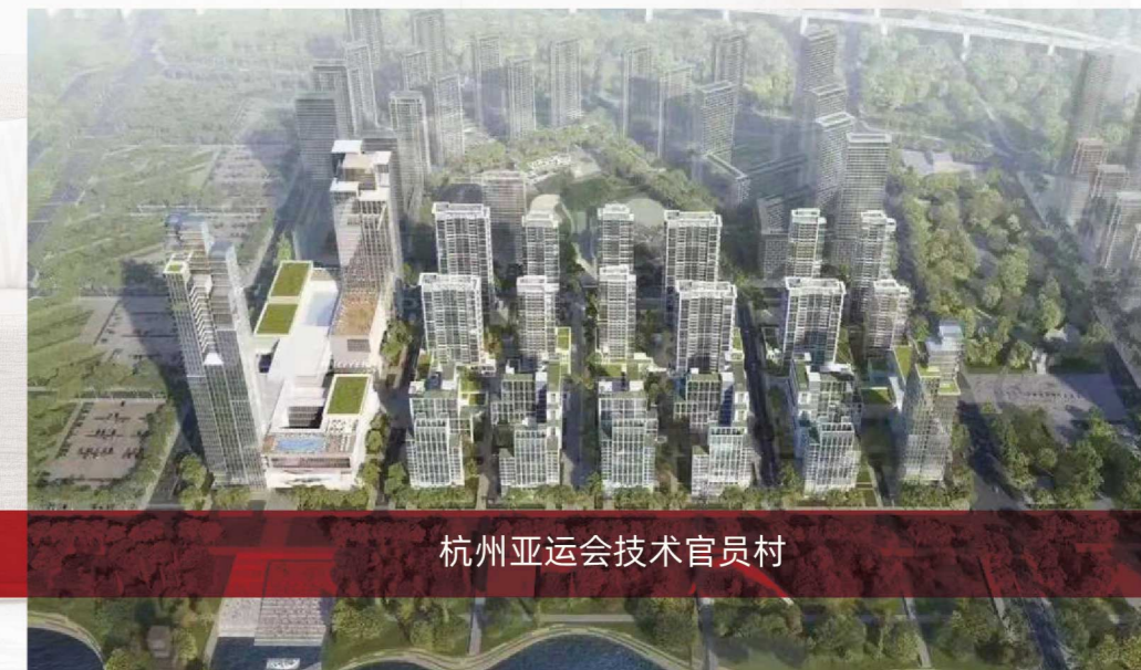
杭州亚运会技术官员村